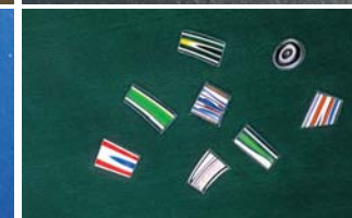
Legno con inserti di murrine Wood with Murrina Inserts / Holz mit Einsätzen aus Murrina-Glas