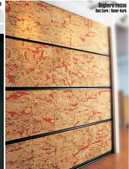
Sughero rosso Red Cork / Roter Kork