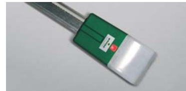
DUO SL 650