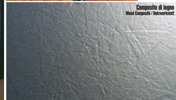
Composito di legno Wood Composite / Holzwerkstoff