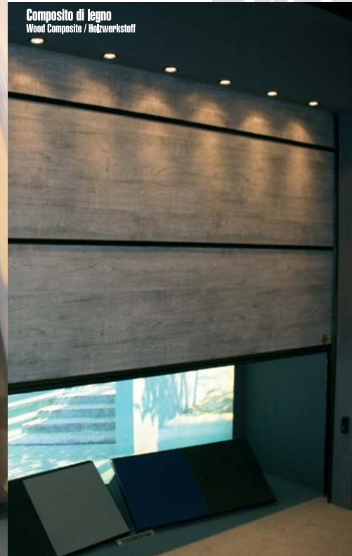
Composito di legno Wood Composite / Holzwerkstoff