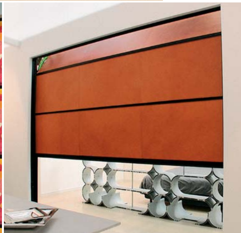
Cuoio naturale Natural leather / Naturleder