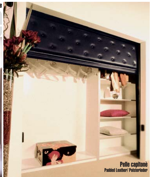
Pelle capitonè Padded Leather / Polsterleder