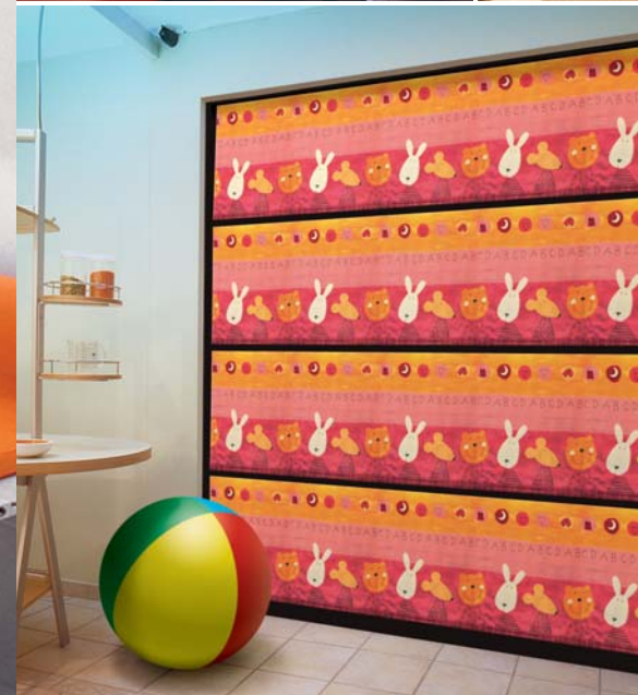
Textile Jewels Base