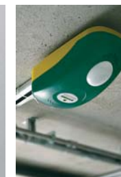
V800E / V800 PLUS