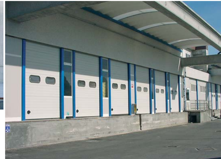
Portone Sezionale Cargo Base Base Cargo Sectional Shutter Door / Cargo Sektionaltor Base