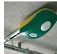
V800E / V800 PLUS