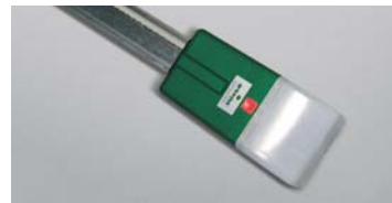
DUO SL 650